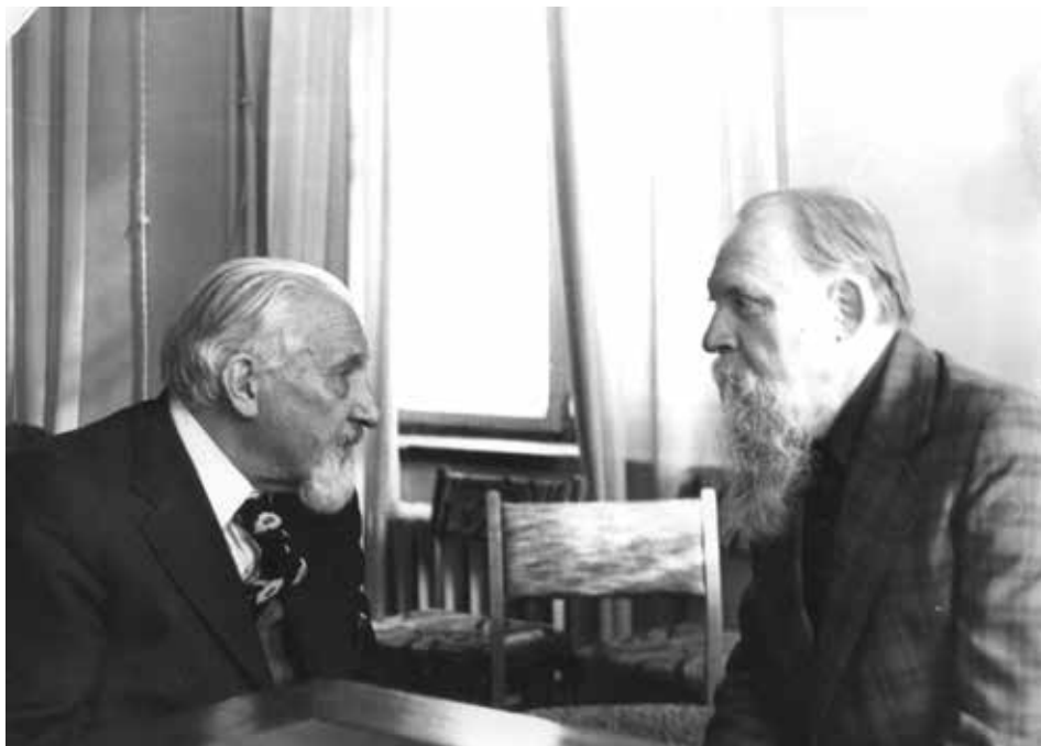
В.А. Мошин и Н.И. Толстой. Москва. Конец 1970-х гг.